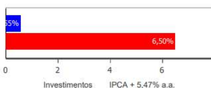
Investimentos x Meta de Rentabilidade

Para efeito de comparativo (Tabela IV), o cálculo das rentabilidades foi feito através da média das rentabilidades obtidas nos fundos de investimentos ponderados pelo